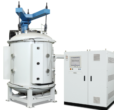
HP-NITRIDING SERIES High Performance Nitriding System for Energy Saving 고밀도 플라즈마 활용에 따른 친환경 · 고속 질화처리 기술