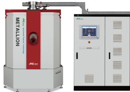
METALLION SERIES Metal Cathodic Arc Ion Plating System 다양한 종류의 하드 코팅을 위한 솔루션