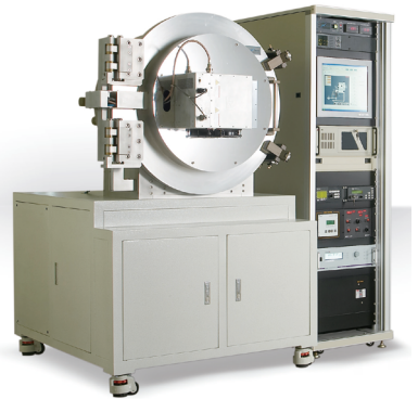
CARBOZEN-C SERIES Plasma Enhanced CVD System 고순도 및 하드 코팅을 위한 솔루션