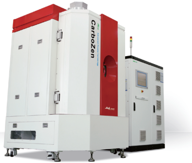
CARBOZEN-H SERIES Advanced Hybrid Coating System 초경질 코팅과 컬러 코팅을 위한 솔루션