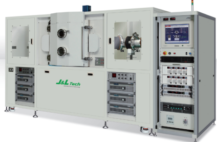
CARBOZEN-FA SERIES Filtered Cathodic Vacuum Arc System 우수한 표면조도 및 초경질 코팅을 위한 솔루션